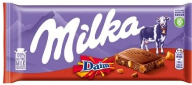
Milka Daim 100g