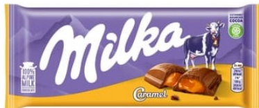
Milka Caramel 100g