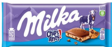
Milka Chips Ahoy 100g