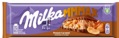
Milka Mmmmax Peanut Caramel 276g