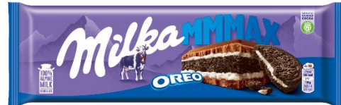
Milka Mmmmax Oreo 300g