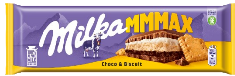
Milka Mmmmax Choco & Biscuit 300g