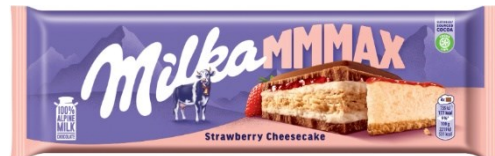
Milka Mmmmax Strawberry Cheesecake 300g