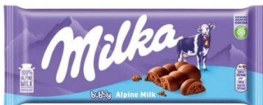
Milka Bubbly Alpine Milk 90g