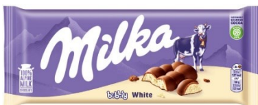
Milka Bubbly White 95g