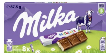
Milka Milkinis 87,5g