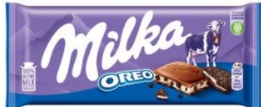
Milka Oreo 100g