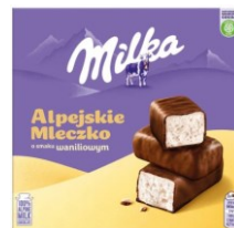
Milka Alpejskie Mleczko o smaku waniliowym 330g