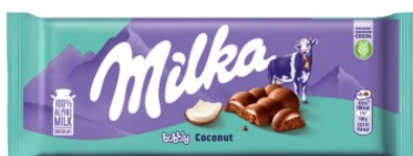
Milka Bubbly Coconut 97g